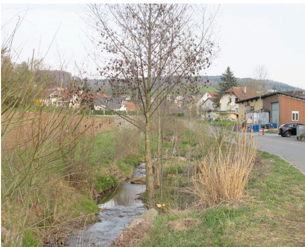
Revitalisierung von Fliessgewässern am Siedlungsrand Bachöffnung aufgrund der Bautätigkeiten mit neuer Kanalisationserschliessung. Ergebnis: attraktives Landschaftsbild, neuer Lebensraum als Fliessgewässer, verbesserte Vernetzung, gesteigerte Naherholung für die Bevölkerung.

Oftmals wird der Bauzonenrand nicht als ein eigenständiges Siedlungsrand-Projekt behandelt und gestaltet. Vielmehr gibt es verschiedene Gelegenheiten bei anderen Bauprojekten, die zur Aufwertung des Siedlungsrandes genutzt werden können. Eine dieser Möglichkeiten ist, eingedolte Gewässer wieder zu öffnen und revitalisieren.