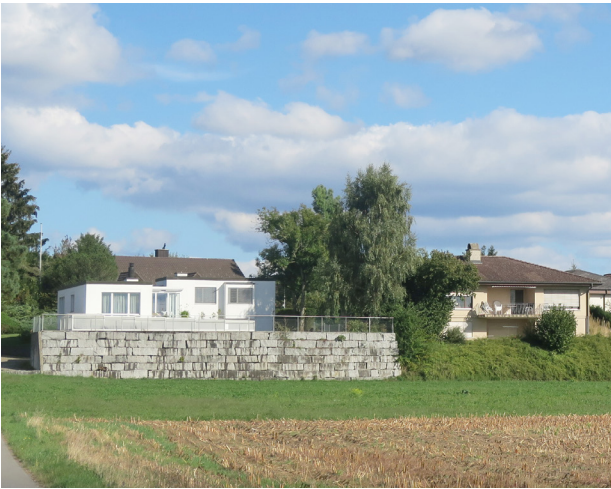
Bauprojekte am Siedlungsrand Im Bewilligungsverfahren kann Einfluss genommen werden. So lassen sich z.B. wuchtige Stützmauern und störende Terrainveränderungen vermeiden.

Eine Schlüsselrolle für hochwertige Übergangsbereiche zur Landschaft kommt Bauprojekten und Veränderungen an den Freiräumen auf Grundstücken zu, welche an oder in der Nähe von Siedlungsändern liegen.