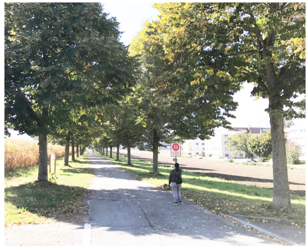
Wegangebote schaffen Lebensqualität Neugestalteter Siedlungsrand mit integriertem Wanderweg

Häufig führen deshalb Fuss- und Flurwege entlang der Siedlungsränder. Entstehen neue Projekte in diesen Übergangsbereichen, empfiehlt es sich, das übergeordnete Wegnetz genau zu untersuchen, fehlende Wegabschnitte zu schliessen und für die Bevölkerung neue Wegangebote zu prüfen. Die Zugänglichkeit und Durchlässigkeit spielen eine zentrale Rolle. Zu klären ist die Frage, wie man von der Siedlung und ihren Freiräumen in das offene Kulturland gelangt und wie die Freiräume ins Fusswegnetz eingebunden sind. Ausgewählte Siedlungsränder können in das kommunale Fuss- und Wanderwegnetz integriert und gestalterisch aufgewertet werden (z.B. mit wegbegleitenden Alleen, Baumgruppen oder Heckenelementen).