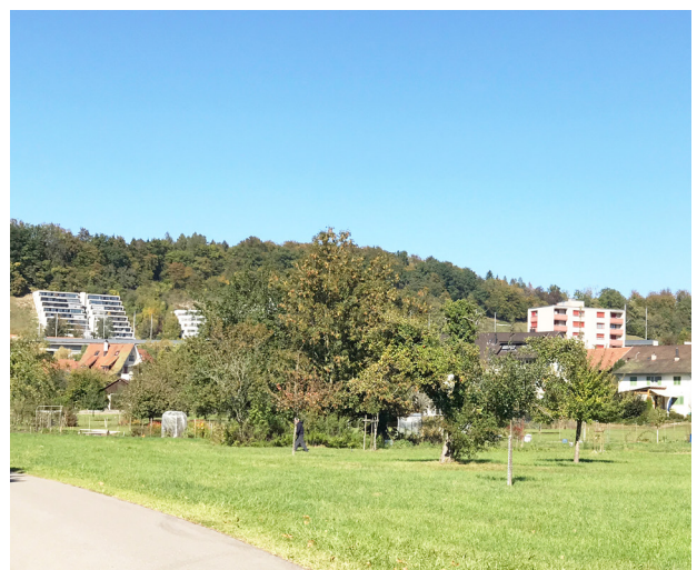
Synergiemöglichkeiten im Übergangsbereich von Landschaft und Siedlungsraum Multifunktionaler Siedlungsrand mit Schrebergärten, Obstgärten und landwirtschaftlicher Nutzung.

Mit dem Programm „Landwirtschaft – Biodiversität – Landschaft (Labiola)“ fördert der Kanton Aargau solche gemeinwirtschaftlichen Leistungen der Landwirtschaft im Kulturland. Der Landwirt kann so auf freiwilliger Basis verschiedene Massnahmen im Bereich der Biodiversität und der Landschaftsqualität in einem Bewirtschaftungsvertrag integrieren. Sinnvollerweise werden solche Elemente auch an Siedlungsändern angelegt.