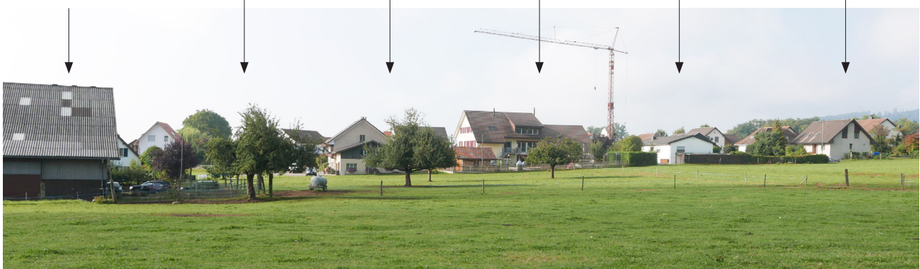
Einflussfaktoren auf die Prägung und Gestaltung der Siedlungsränder

f) Gesellschaftliche, soziale Bedeutung, Begegnungsraum