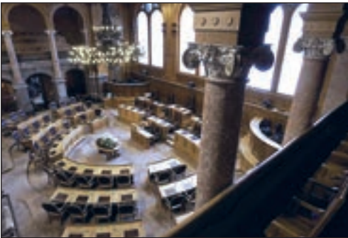
Ständeratssaal in Bern

Die Zuteilung der Sitze an die teilnehmenden Parteien erfolgt direkt proportional.