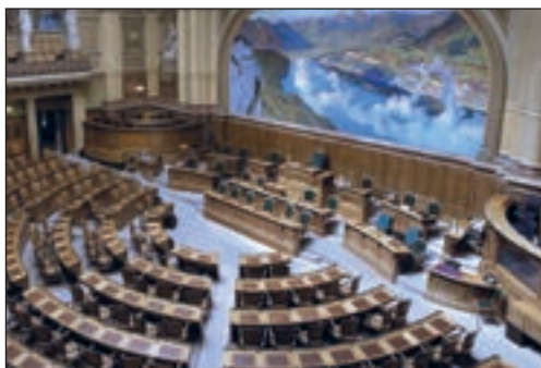
Nationalratssaal in Bern

Die Zuteilung der Sitze an die teilnehmenden Parteien erfolgt gemäss doppeltproportionaler Divisormethode „Doppelter Pukelsheim“.