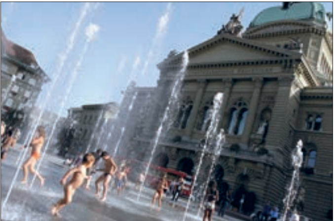
Bundeshaus in Bern

Die Schweiz ist die einzige Demokratie, die ihren Stimmbürgern die beiden Volksrechte Referendum und Initiative so umfassend gewährt!