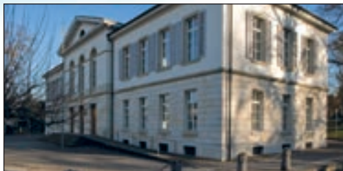
Grossratsgebäude in Aarau